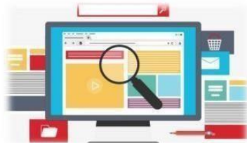
Sitio web del establecimiento educacional.

La Comunidad escolar debe tomar conocimiento del Reglamento Interno y sus modificaciones, los cuales deben estar publicados en: