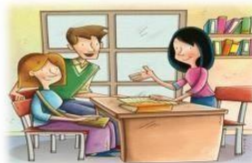
Se entregará una copia del Reglamento Interno y sus documentos anexos a los padres, madres y apoderados, al momento de la matrícula.