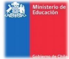
Plataforma que el Ministerio de Educación determine.