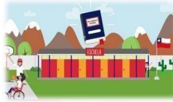
Disponible en el recinto para consulta de los estudiantes, padres y apoderados.